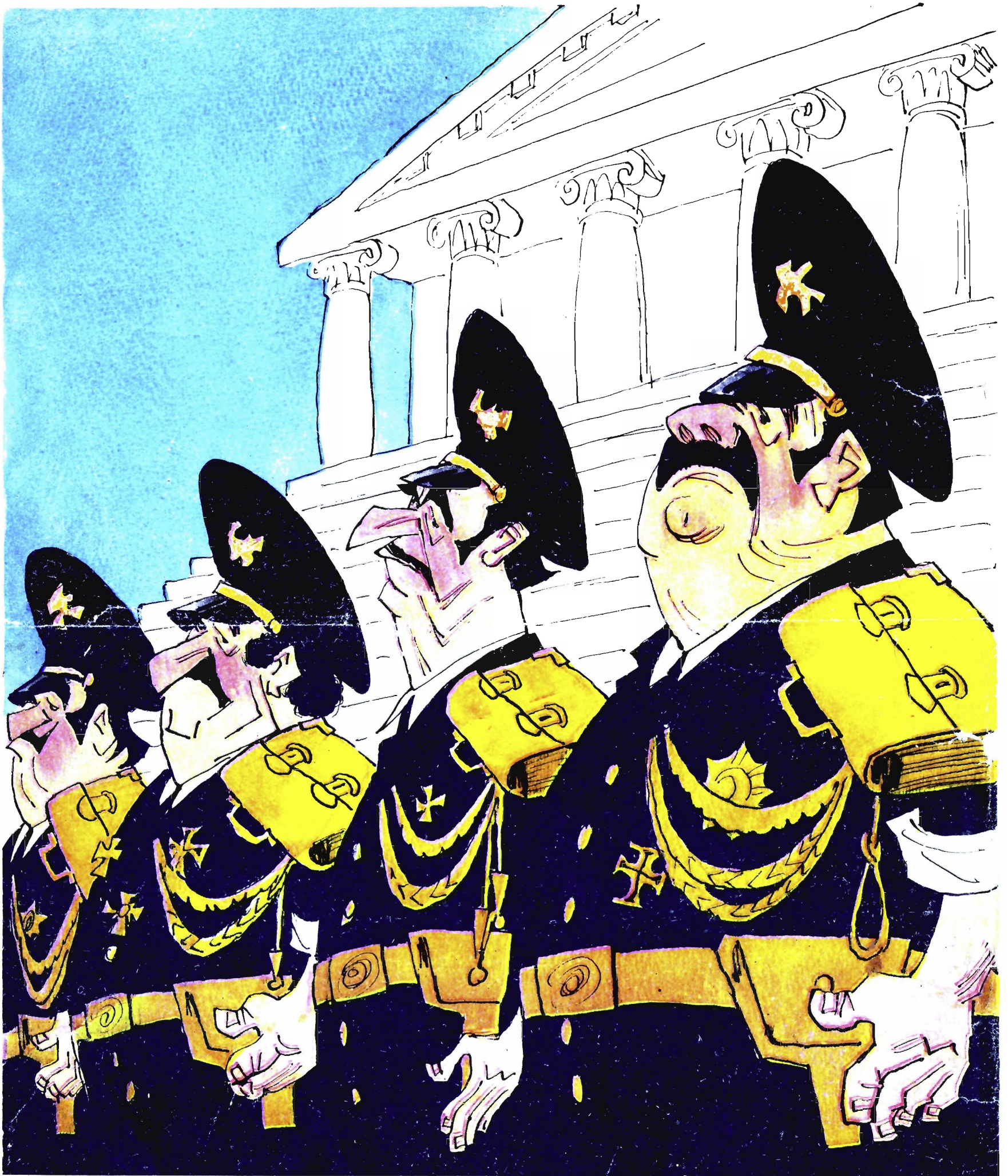
Распределение министерских портфелей в Греции идет чин по чину.