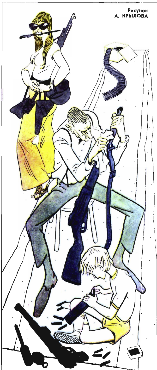
Рисунок А. КРЫЛОВА

Не удастся им только попасть в своем первоначальном виде в Советский Союз и другие социалистические страны. И поэтому жалуются они на «коммунистические режимы» — негостеприимные, мол, там живут люди. А мы, как раз напротив, люди гостеприимные. Только чистоплотные. И не любим, когда в нашем доме заводится грязь. Даже если на этой грязи стоит самая что ни есть заграничная марка.